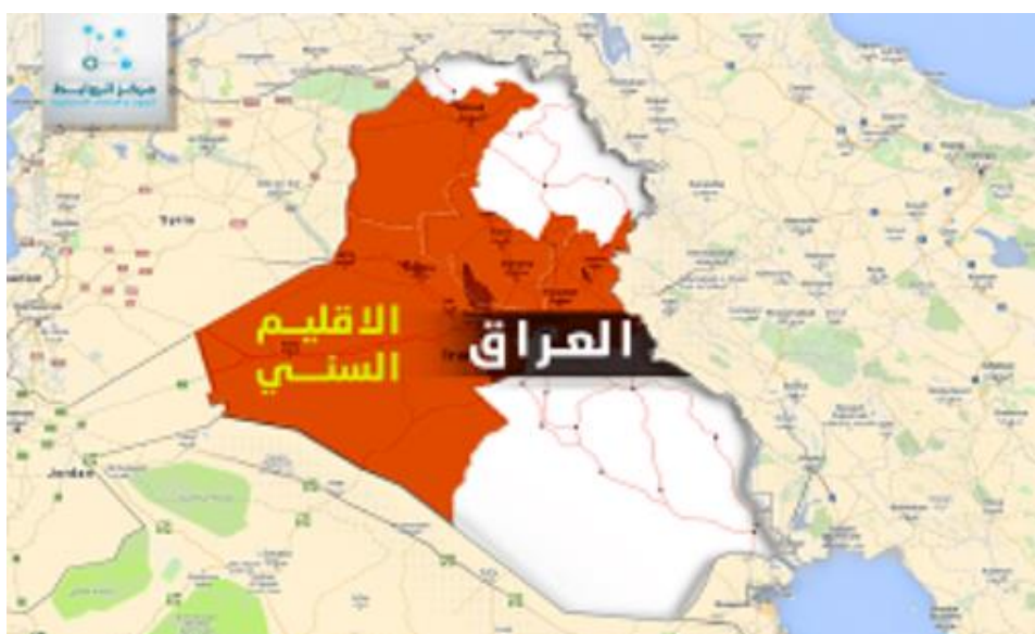
نقشه اقلیم سنی عراق

در برخی محافل نیز با نگاه صرفا اقتصادی بدون توجه به واقعیت ها، به گونه ای تبلیغ می شود که با تجزیه عراق و تشکیل اقلیم شیعی، تمام ارتباطات عراق با دریاها و آزاد را شیعیان در دست خواهند گرفت. اما اقلیم سنی، منطقه ای ایزوله و در محاصره خواهد بود؛ همچنین به دلیل قرار گرفتن غالب منابع نفتی و آبی عراق در مناطق جنوب عراق، شیعه بیشترین سود را از تجزیه عراق را کسب خواهد کرد. و در مقابل اقلیم سنی، به دلیل بیابانی بودن مناطق وسیعی از این اقلیم همچون منطقه الانبار، بیشترین ضرر را متحمل می شود.